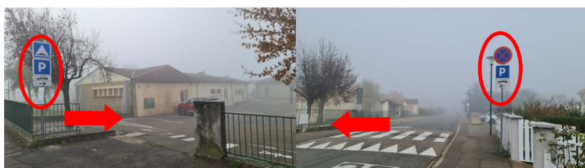
Entrée par la cour de l'ancienne école